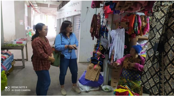
Gambar 2. Kios-Kios zona/lantai 2 dan lantai 3 Pasar Rakyat Singamandawa

Konsep bangunan Pasar Rakyat Singamandawa menganut konsep pasar diatas awan, dimana pada bangunan lantai 3 pasar terdapat area stage dilatar belakang oleh pemandangan 3 gunung yang terlihat dari atas pasar. Selanjutnya pasar ini menganut konsep open space dimana dari dalam pasar masih kelihatan pemandangan yang melatar belakang bangunan tersebut. 21 Fungsi tambahan juga penting yang harus mengutamakan faktor estetika dan kemewahan maupun penunjang fasilitas sebagai daya tariknya. 22